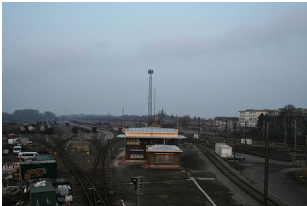
Saint-Ghislain, house of the rising sun

Car arrivés à Saint-Ghislain, nous sommes en retard sur le soleil, mais ça n'a plus aucune importance : avec la couverture nuageuse et le plafond bas, le ciel a simplement viré du noir d'encre au gris laiteux. Quant au point de vue en hauteur, le pic local s'avère être le pont routier qui enjambe la voie de chemin de fer.